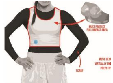
Abb. Ringsport / T-Shirt bei LC, PF, KL 1

Merke: Diese Vorschriften müssen jedoch komplett und nicht lediglich teilweise eingehalten werden.